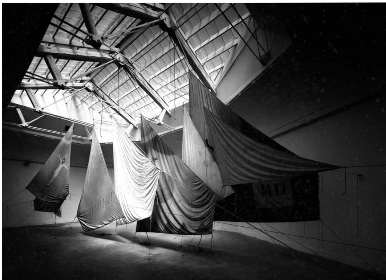
Uden titel, 1993. Gamle sejl og tovværk. Variable mål.