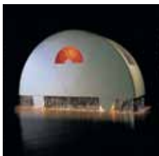
Træ, gummi, akryl, halogenlys, blæsemotor. Mål: 4,00 x 2,04 x 1,20 m. Fotograf Poul Ib Henriksen.

Det ultimative foyerværk er Springvand. Lyden af det rindende vand matcher forestillingen om at træde ind i et eksklusivt foyerområde. Den kølige ro og den høje slanke form kobles på subtil vis med vandets og lysets sitrende transparens. Cronhammar har beskrevet sine værker som "hytter til andagt" eller "stillesteder" – her har det fundet en yderst smuk form.