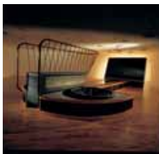
Træ, stål, glas, gummi. Mål: 8,70 x 4,50 x 2,20 m.

Skibsmetaforen er til at tage og føle på: en bro, en stævn og en natmørk horisont. Et udsigtspunkt, hvorfra du kan bemægtige dig verden, eller lade verden bemægtige sig dig? Et sort hul tårner sig op som et kæmpe monokromt maleri for enden af en slags gangbro. Værket er en synsmaskine, et transformationssted for tanken: Er det tomhed eller fylde du ser i spejlets sorte refleksion?