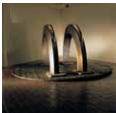
Jern, træ, asfalt, gummi, hestetænder og – knogler, glasfiber. Mål: 1,36 x 3,00 m.

To buer står udspændt over en rund træbund og åbner sig som en frygtindgydende "mund". Hestetænder springer aggressivt frem mellem gummer af matsort gummi. Titlen Skrig i Vilden Nat vækker uhyggelige associationer af nærmest før-sproglig karakter. Cronhammar beskriver selv skulpturens mørke som altdominerende: "Den er ren trussel, ren terror, ren angst og smerte. Den er ondskabsfuld som ind i Helvede."