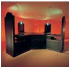
Træ, glas, olie, pumpe. Mål: 4,74 x 4,14 x 2,05 m.