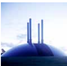
Stål, beton, røde akryl kupler, gasbrænder. Mål: Højde: 32,00 m. Diameter: 60,00 m.

Abyss er lige dele skulptur og arkitektur. En enkel søjlebåren konstruktion formet som en rombe. Den står som et monument i det offentlige rum og er med den hvidmalede overflade forsonlig i forhold til sine omgivelser og det arkitektoniske landskab i Birk Centerpark. Skulpturens mørke indre afslører en nattehimmel med små lysende stjerner, der genspejles i vandbassinernes dybe afgrund.