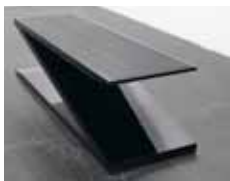
Bemalet stål og corian. Mål: 0,50 x 0,50 x 1,70 m.