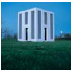
Beton, strækmetal, glas, vandbassiner, LED lys. Mål: Højde: 7,00 m. Længde: 9,00 m. Bredde: 4,50 m.

Abyss er lige dele skulptur og arkitektur. En enkel søjlebåren konstruktion formet som en rombe. Den står som et monument i det offentlige rum og er med den hvidmalede overflade forsonlig i forhold til sine omgivelser og det arkitektoniske landskab i Birk Centerpark. Skulpturens mørke indre afslører en nattehimmel med små lysende stjerner, der genspejles i vandbassinernes dybe afgrund.