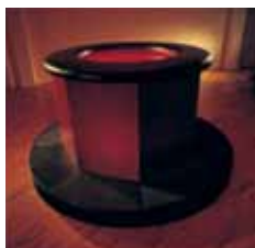
Træ, stål, gummi, glas, akryl, lys. Mål: 2,70 x 1,35 m.

En brønd lyst op indefra. En døbefont eller en lille karrusel med et gummi-polstret bolværk? Nederst er der et lille trappetrin, hvorpå du kan træde op og bøje dig over brønden og skue hvad? Et kort, hvor fjendens og egne stillinger er tegnet ind; et bombesigte! Associationerne antager mere krigerisk karakter. Cronhammar udfordrer os. Værket er en del af Heart of Darkness-værktrilogien, der refererer til Coppolas film Apocalypse Now.