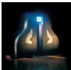
Træ, gummi, glas, svanevinger, lysstofrør. Mål: 1,40 x 4,60 x 2,70 m.

Som en portal tårner to matsorte gummi-beklædte monolitter sig op omkring to hvide svanevinger. Svanevingerne, der er et klassisk symbol på den himmelske opløftning, folder sig smukt ud, men er samtidig kapslet ind bag glas som standset tid. Neonrørene, der binder monolitterne sammen, kaster et blåligt lys fra sig. Værket er en port, et transformationssted, der foreslår en forløsning af nærmest religiøs karakter.