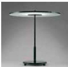
Stål, messing, glas, diode lys. Mål: 0,453 x 0,425 m.

Vi overrumpler, når vi betragter Stealth-bestikkets skønhed og gru. Bestikket, der formmæssigt fortolker Stealth-flyets vinkler, er knivskarpt og udført i en ekstra lang udgave. Vi mærker ubehaget næsten fysisk, når vi forestiller os at spise med bestikket. Gør det mon ondt?