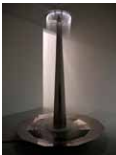
Poleret rustfri stål, LED lys, vandpumpe. Mål: 3,20 x 2,40 x 2,40 m. Fotograf Nils Stærk.

Det ultimative foyerværk er Springvand. Lyden af det rindende vand matcher forestillingen om at træde ind i et eksklusivt foyerområde. Den kølige ro og den høje slanke form kobles på subtil vis med vandets og lysets sitrende transparens. Cronhammar har beskrevet sine værker som "hytter til andagt" eller "stillesteder" – her har det fundet en yderst smuk form.