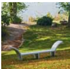
Overfladebehandlet aluminium og corian. Mål: 1,00 x 3,80 x 0,50 m.