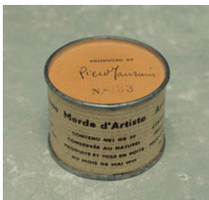
Merde d'artiste af Piero Manzoni. Genstande: Ark og glas med hår.