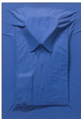
Blå skjorte af Sven Dalsgaard. Genstande: Ark og et blåt stykke stof.