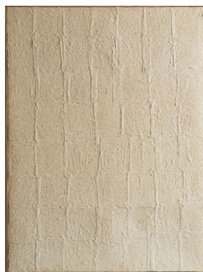
Acrome af Piero Manzoni. Genstande: Ark og følerum.